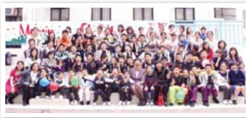
眾表演者及學生會幹事與校長合照。