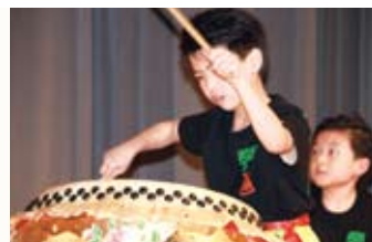
小小鼓手，功架十足。