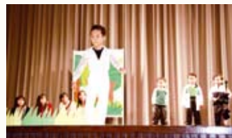
充滿自信的小矮人在台前獻舞。