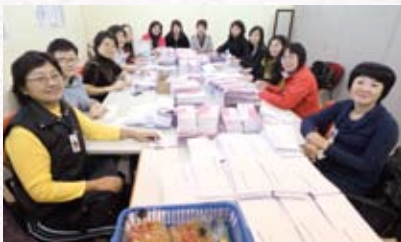
九十分鐘處理三千份郵件，效率驚人！

PTA 十分支持學校重建籌款，例如負責「一磚一瓦建英華」資料輸入工作、包裹重建步行籌款紀念品、曲奇餅義賣、有機香草義賣等。