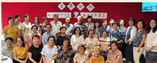
◀多位校長及老師賞面出席午餐，主恩實在豐富。