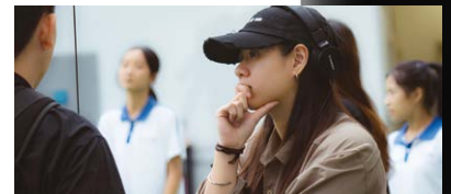
▲ Watching playback at the scene