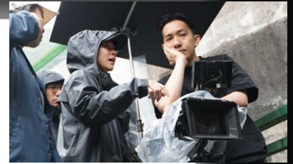
▲ Filming on a rainy day