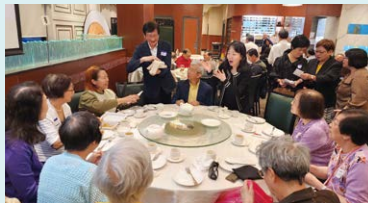
▲ Handing out the school souvenirs