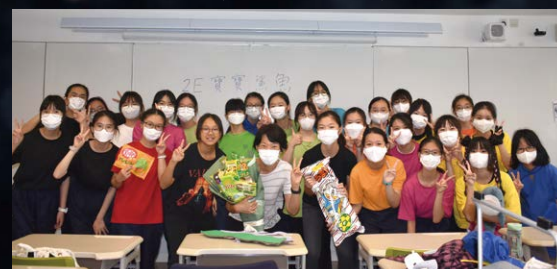
▲ 2E班在ITQ決賽後於課室合照