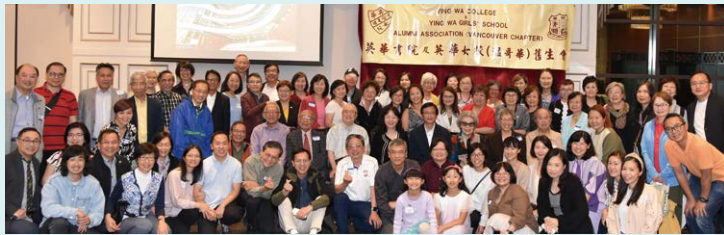
▲ One big happy Ying Wa family

After a long hiatus of three years due to COVID-19 lockdown, we were able to hold our annual dinner again on 24 July, 2023, thanks to the support of old boys of Ying Wa College in setup for venue and sound system, as well as the hard work of our Vancouver Chapter committee and great support from alumnae. This joyous occasion was well attended by over 80 participants, including alumnae from different generations whose ages range from the 20s to the 90s.