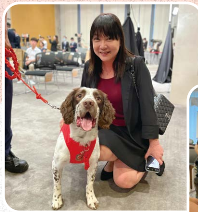
▲ Moo 十分喜歡小動物