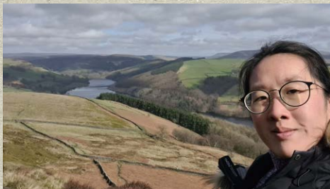
▲ 離曼城一小時車程的 Peak District 國家公園

聽不少人說英國生活沉悶單調，但這些年來英國為我帶來很多不同體驗。愛好遠足的我，趁天氣回暖去了附近的國家公園。