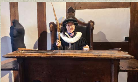
▲ 穿著莎士比亞當時上學的校服拍照留念

今年一月與父母去了莎士比亞出生的小鎮 Stratford-upon-Avon，參觀了他上學的課室。導遊生動地講解英國中世紀教育歷史，令我獲益良多。