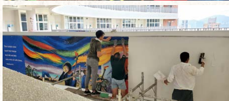
▲壁畫拼砌、組裝過程