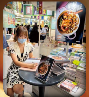
▲2022年於香港書展舉辦的簽名會