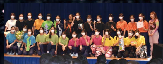
▲ 亦獲得最受歡迎獎 (由觀眾投票選出)