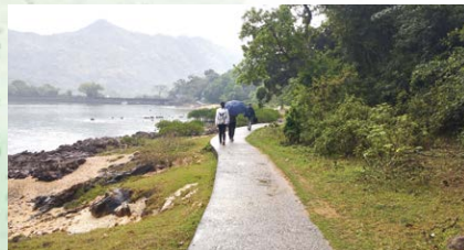
▲ A rainy walk towards the Hakka villages in Kuk Po