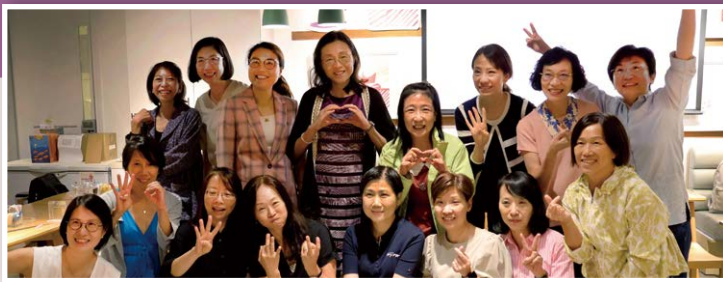
▲一班 83 年中五畢業的同學，四十年後也改變不大呢！