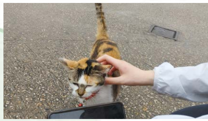
▲ One of the extremely sociable fishermen's cats on Ma Shi Chau

The trips were well-organised, bringing many hands-on experiences that hammered this invigorating programme's essence home. Thanks to the programme, I am now enthusiastic about the future of local sustainable tourism, having seen with my own eyes the treasure trove of culture, ecology and history of Hong Kong.