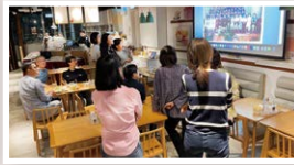
▲看著螢幕上的舊照片，百感交集！