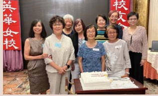
▲ Past and present committee members since our Chapter was set up in 1988