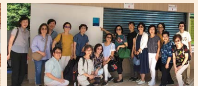
▲73年中五畢業同學捐贈小食部，希望提神美食，源源不絕。