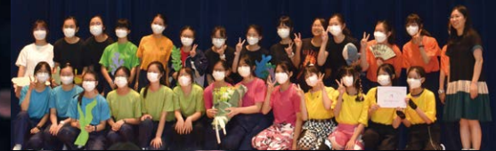
▲ 上學年的2E班以《寶寶鯊魚》勇奪最佳表現獎 (其他類別)

比賽的準備過程並非一帆風順，但最終也達到了出乎預期的成果。參賽者表現踴躍，成功找到自身獨特之處，並留下無法取代的珍貴回憶。觀眾亦熱烈回應，毫不吝嗇支持與讚賞，令現場氣氛高漲。在彼此的鼓勵中，不論是輸是贏，大家都獲益匪淺。