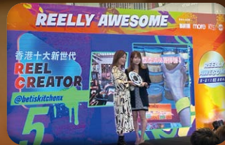
◀ Reel Creator 頒獎典禮