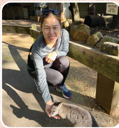
▲ Olivian 攝於澳洲