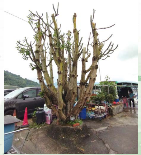
▲ An unusual sighting of a highly lignified cactus