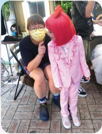
▲ 與戲中角色細朱合照 (這是戲中角色扮演比賽一幕的造型)